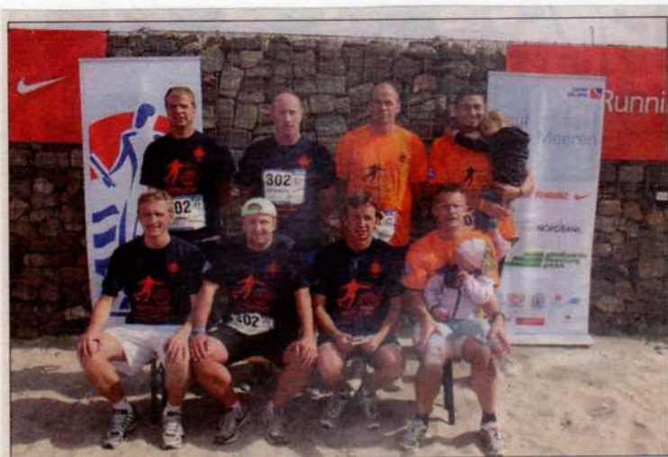
Team Doppelpass aus Nortorf